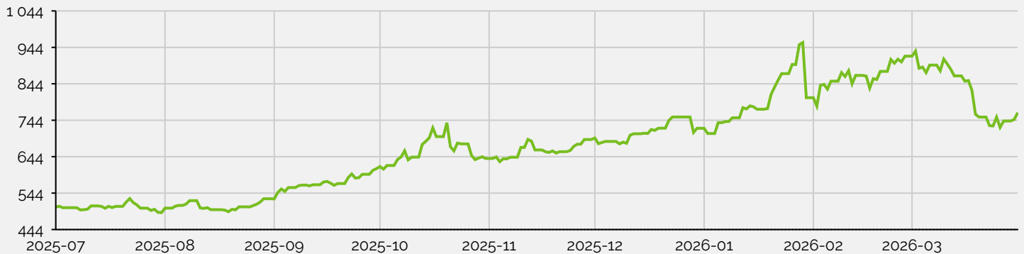
Wykres notowań od: 2025-07-01 do: 2026-03-31.