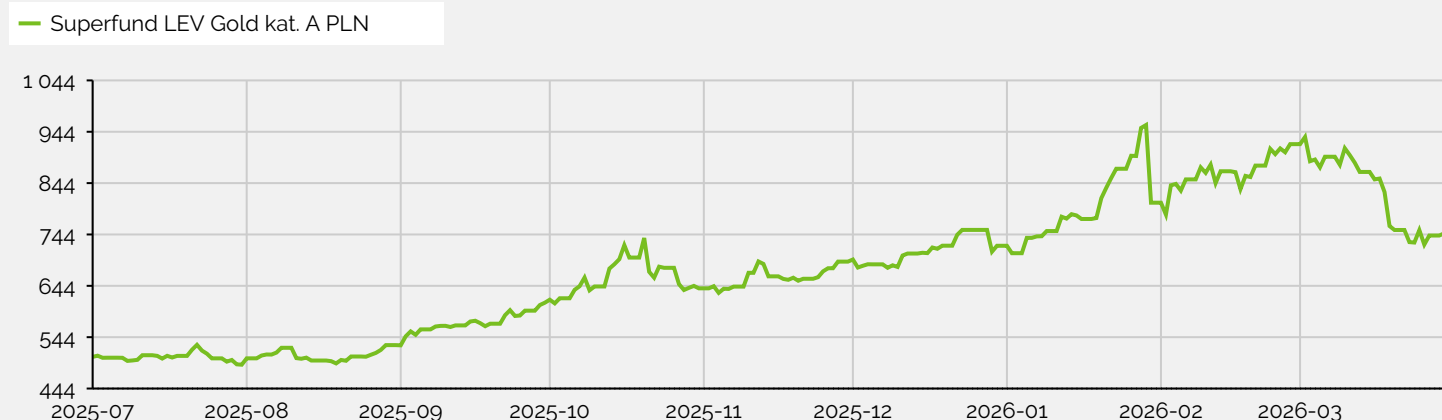
Wykres notowań od: 2025-07-01 do: 2026-03-31.