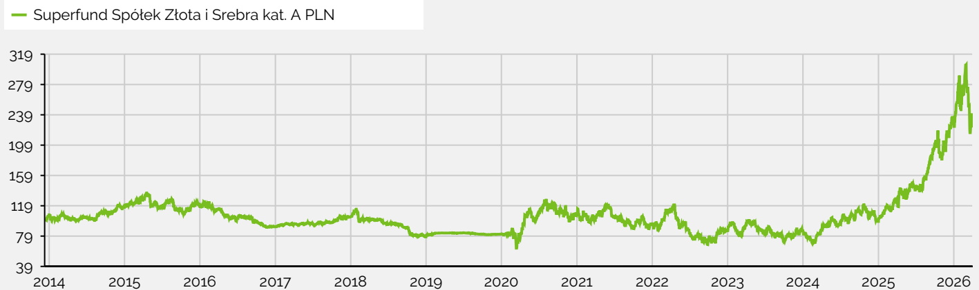
Wykres notowań od: 2013-12-10 do: 2026-03-31.